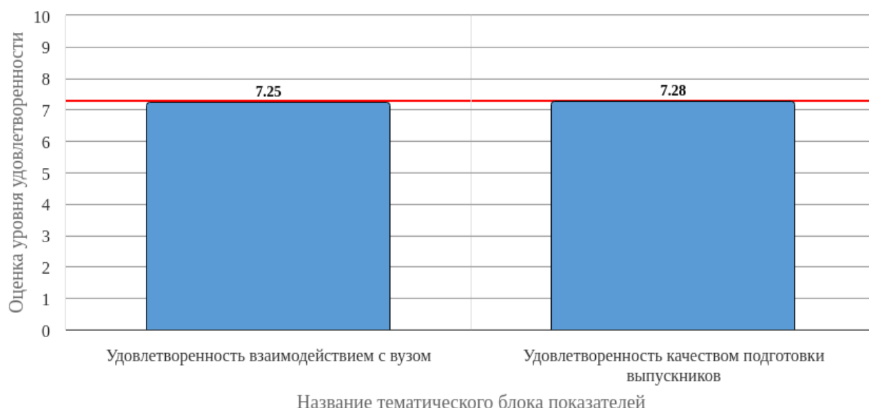
Рисунок 3.1 - Средняя оценка удовлетворенности (по тематическим блокам показателей)

Средняя оценка удовлетворенности респондентов по блоку вопросов «Удовлетворенность взаимодействием с вузом» равна 7.25, что является показателем повышенного уровня удовлетворенности (50-75%).